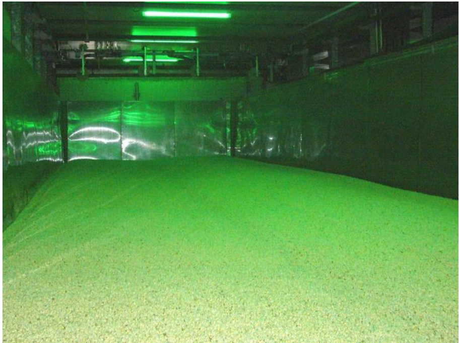
ပဲပင်ပေါက် အပင်ပေါက်ဖောက်ခန်း