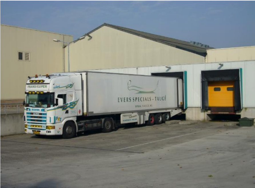
အအေးခန်းပါ သယ်ယူပို့ဆောင်ရေးယာဉ်