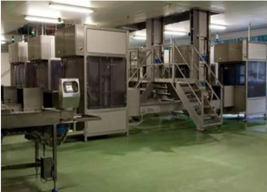
ထုပ်ပိုးမှုစနစ်